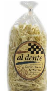
AD102 FETTUCCINES PERSIL ET AIL PDSF 4,99 $ 341 G 6 /CAISSE