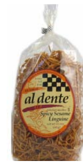
AD106 LINGUINES SÉS- AME ÉPICÉ PDSF 4,99 $ 341 G 6 /CAISSE