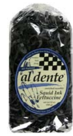
AD160 FETTUCCINES À L'ENCRE DE SEICHE PDSF 5,99 $ 341 G 6 /CAISSE