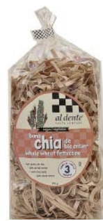
AD152 FETTUCCINES CHIA ET BLÉ ENTIER PDSF 4,99 $ 341 G 6 /CAISSE