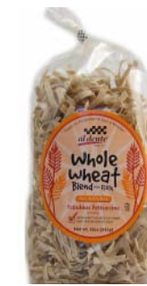
AD107 FETTUCCINES AU BLÉ ENTIER PDSF 4,99 $ 341 G 6 /CAISSE