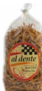
AD109 FETTUCCINES AU PIMENT ROUGE PDSF 4,99 $ 341 G 6 /CAISSE