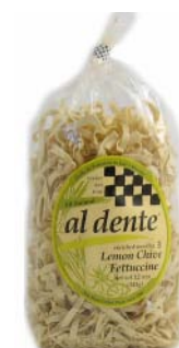
AD110 FETTUCCINES CIBOULETTE ET CITRON PDSF 4,99 $ 341 G 6 /CAISSE

FETTUCCINES À L'ENCRE DE SEICHE / LES FETTUCCINES À L'ENCRE DE SEICHE SONT DÉLICIEUSES ACCOMPAGNÉES DE FRUITS DE MER ET DE POIVRONS ROUGES. À L'APPROCHE DE L'HALLOWEEN, AJOUTEZ-Y NOTRE SAUCE À LA COURGE MUSQUÉE DE DAVE'S GOURMET POUR UN EFFET À LA FOIS SPECTACULAIRE ET DÉLICIEUX!