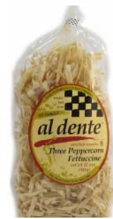
AD108 FETTUCCINES AUX TROIS POIVRES PDSF 4,99 $ 341 G 6 /CAISSE