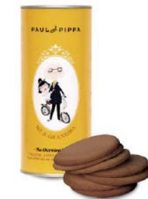
PP03 BISCUITS BIO POMME ET CANNELLE PDSF 7,99 $ 125 G 6 /CAISSE