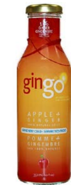
GI02 GINGO POMME ET GINGEMBRE PDSF 3,99 $ 355 ML 12 /CAISSE