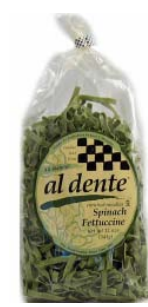
AD101 FETTUCCINES AUX ÉPINARDS PDSF 4,99 $ 341 G 6 /CAISSE