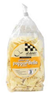
AD140 PAPPARDELLES AUX ŒUFS PDSF 4,99 $ 341 G 6 /CAISSE