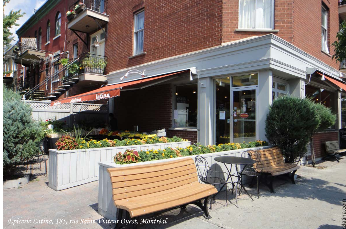
Épicerie Latina, 185, rue Saint-Viateur Ouest, Montréal