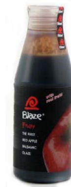
AC40 BLAZE POMME PDSF 10,99 $ 215 ML 12 /CAISSE