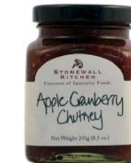
SK306 CHUTNEY AUX POMMES ET CANNEBERGES PDSF 7,99 $ 241 G 12 /CAISSE