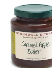
SK707 BEURRE CAMEL ET POMME PDSF 8,49 $ 340 G 12 /CAISSE