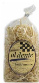
AD105 FETTUCCINES AU BASILIC PDSF 4,99 $ 341 G 6 /CAISSE