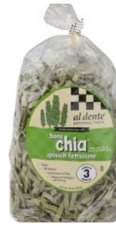
AD151 FETTUCCINES ÉPINARDS ET CHIA PDSF 4,99 $ 341 G 6 /CAISSE