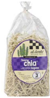
AD150 FETTUCCINES AU CHIA PDSF 4,99 $ 341 G 6 /CAISSE