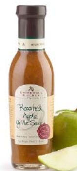
SK533 SAUCE AUX POMMES RÔTIÉS PDSF 8,99 $ 330 ML 6 /CAISSE