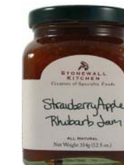
SK130 CONFITURE FRAISE POMME ET RHUBARBE PDSF 8,99 $ 368 G 12 /CAISSE