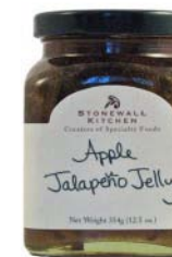
SK125 GELÉE POMME ET JALAPENO PDSF 8,99 $ 354 G 12 /CAISSE