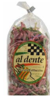
AD104 FETTUCCINES TRICOLORES PDSF 4,99 $ 341 G 6 /CAISSE