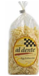
AD103 FETTUCCINES AUX ŒUFS PDSF 4,99 $ 341 G 6 /CAISSE