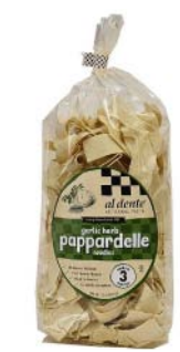
AD141 PAPPARDELLES AUX HERBES ET À L'AIL PDSF 4,99 $ 341 G 6 /CAISSE