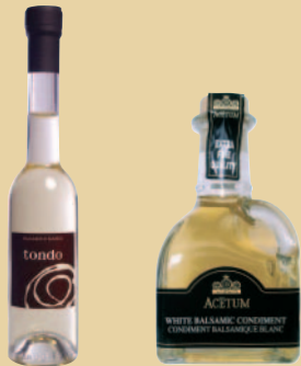
TONDO CUPOLA WHITE

Les condiments blancs ont un goût délicat. Produits avec du concentré de moût de raisin et avec les mêmes vinaigres de vin que les autres balsamiques, ils ne subissent aucun vieillissement et le moût de raisin est clarifié afin qu'ils conservent leur limpidité.