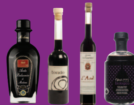
SANTORINI TONDO ASE FAVUZZI

Créés à partir des meilleures sélections de moûts de raisin et de vinaigres de vin, ces balsamiques ont une densité et un goût qui les rapprochent fortement de la catégorie des traditionnels.