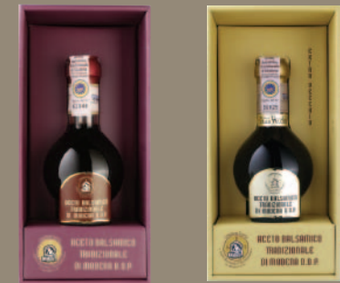
VECCHIO EXTRA VECCHIO

Cadeaux incomparables, ces grands balsamiques sont fabriqués exclusivement à partir de moût de raisin. Vieillis en fût pendant au moins 12 ans, ils bénéficient d'une Appellation d'origine protégée (AOP). La production est limitée et complexe: elle demande un savoir-faire exceptionnel. Cela explique leur prix élevé: jusqu'à 1000 $/litre.