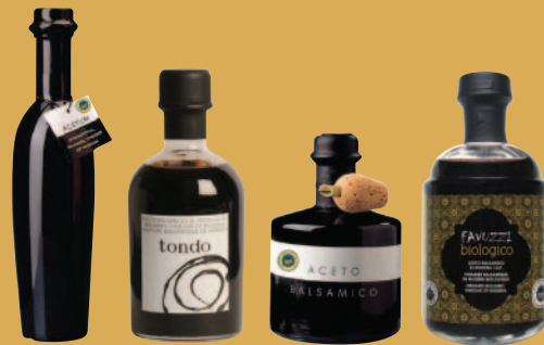
ERA TONDO LAURA FAVUZZI

Ces jeunes vinaigres subissent un processus de vieillissement court. La quantité de vinaigre de vin étant supérieure à la quantité de moût de raisin, ils sont moins concentrés et leur acidité est plus élevée.