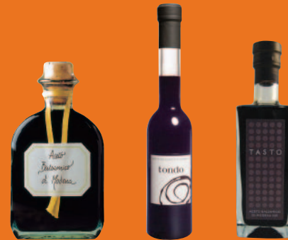
FIASCHETTA TONDO TASTO

Un processus de vieillissement plus long et une concentration plus élevée en moût de raisin apportent à ces vinaigres balsamiques un équilibre parfait dans le goût, entre l'acidité et le sucré.